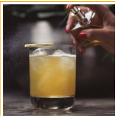
PENICILIN 39. WHISKY, GENGIBRE, MEL E LIMÃO