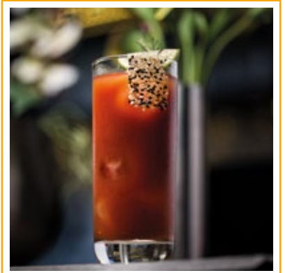
BLOODY MARY 33. VODCA E SUCO DE TOMATE TEMPERADO, LIMÃO, FINALIZADO COM ZATHAR.