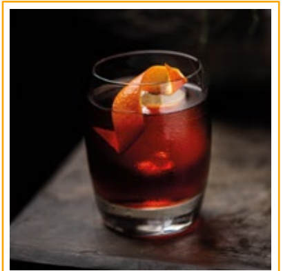
NEGRONI 41. GIN, CAMPARI, VERMOUTH TINTO E PERFUME DE LARANJA