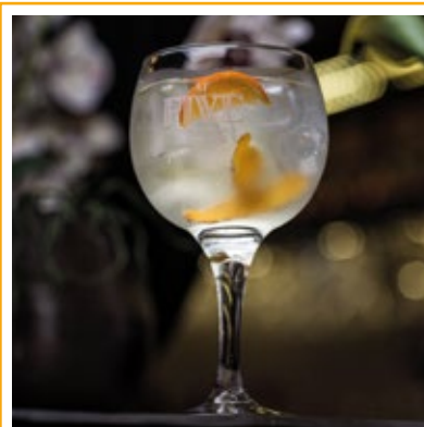
GIN TÔNICA 38. GIN, ÁGUA TÔNICA, BITTER DE LARANJA, SEMENTES DE ZIMBRO, TWIST DE LIMÃO E LARANJA