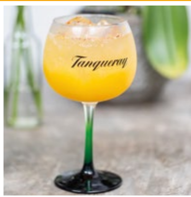
GIN SAJ 41. GIN, RUM, PURÊ DE DAMASCO, PIMENTA, SUCO DE LIMÃO E ESPUMANTE.