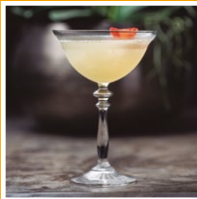
MANISH 41. VODKA, CALDA DE MARACUJÁ, LIMÃO, ESPUMANTE E NOZ MOSCADA.