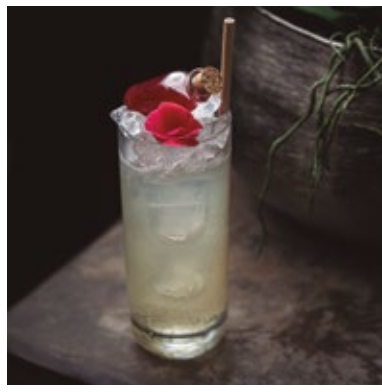
FLAMINGO 41. VODKA, LIMÃO, GINGER E GRENADINE ARTESANAL