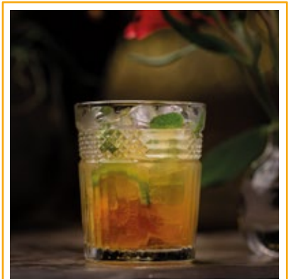
CAIPIRINHA 33. CAIPIROSKA 35. LIMÃO, HORTELÃ E TANGERINA OU UVA, LIMÃO E MEL OU ROMÃ, LIMÃO CRAVO E GENGIBRE