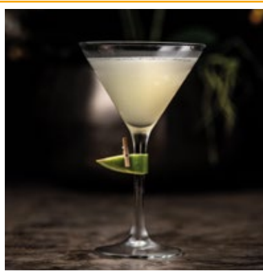
DAIQUIRI 31. RUM, XAROPE DE AÇÚCAR E LIMÃO