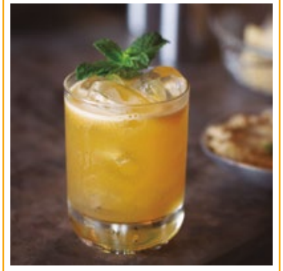
FARABBUD 38. BOURBON, CALDA DE MARACUJÁ, LIMÃO E PIMENTA.