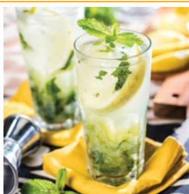
MOJITO DO SHEIK 36. RUM, HORTELÃ, UVAS, SUCO DE LIMÃO, ARAK, ÁGUA DE FLOR DE LARANJEIRA E ESPUMANTE.