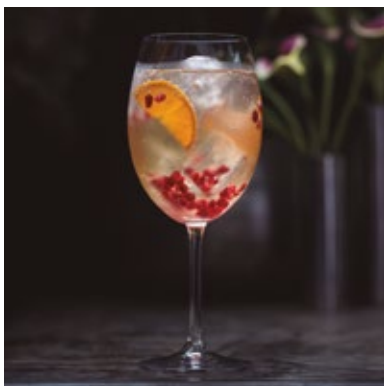
BEKAA 38. LILLET, ROMÃ, TANGERINA E GINGER