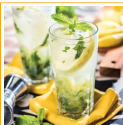
MOJITO DO SHEIK 34. RUM, HORTELÃ, UVAS, SUCO DE LIMÃO, ARAK, ÁGUA DE FLOR DE LARANJEIRA E ESPUMANTE.