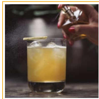
PENICILIN 36. WHISKY, GENGIBRE, MEL E LIMÃO