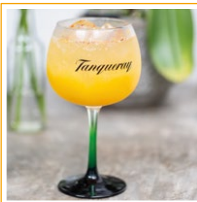
GIN SAJ 39. GIN, RUM, PURÊ DE DAMASCO, PIMENTA, SUCO DE LIMÃO E ESPUMANTE.