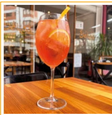
APEROL SPRITZ 35. APEROL, VINHO ESPUMANTE E CLUB SODA