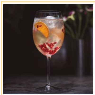
BEKAA 36. LILLET, ROMÃ, TANGERINA E GINGER