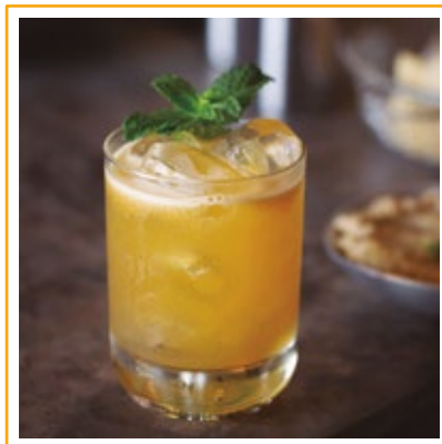
FARABBUD 36. BOURBON, CALDA DE MARACUJÁ, LIMÃO E PIMENTA.