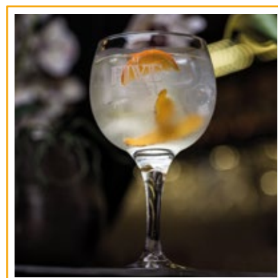
GIN TÔNICA 36. GIN, ÁGUA TÔNICA, BITTER DE LARANJA, SEMENTES DE ZIMBRO, TWIST DE LIMÃO E LARANJA