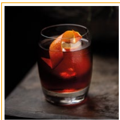
NEGRONI 41. GIN, CAMPARI, VERMOUTH TINTO E PERFUME DE LARANJA