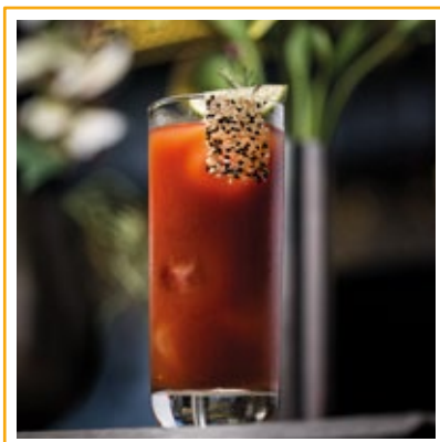
BLOODY MARY 30. VODCA E SUCO DE TOMATE TEMPERADO, LIMÃO, FINALIZADO COM ZATHAR.